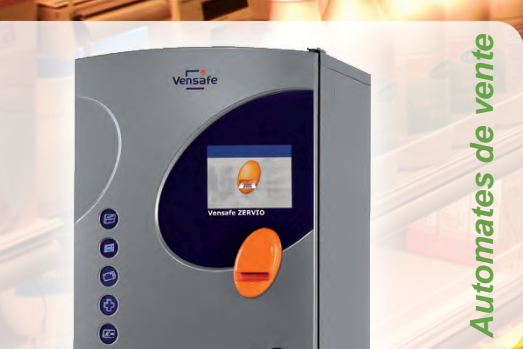
Automates de vente