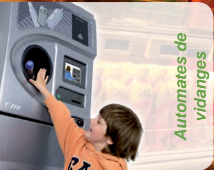
Automates de vidanges